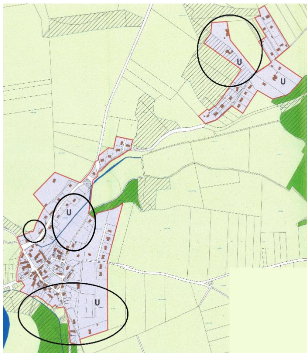
Extrait de la carte communale